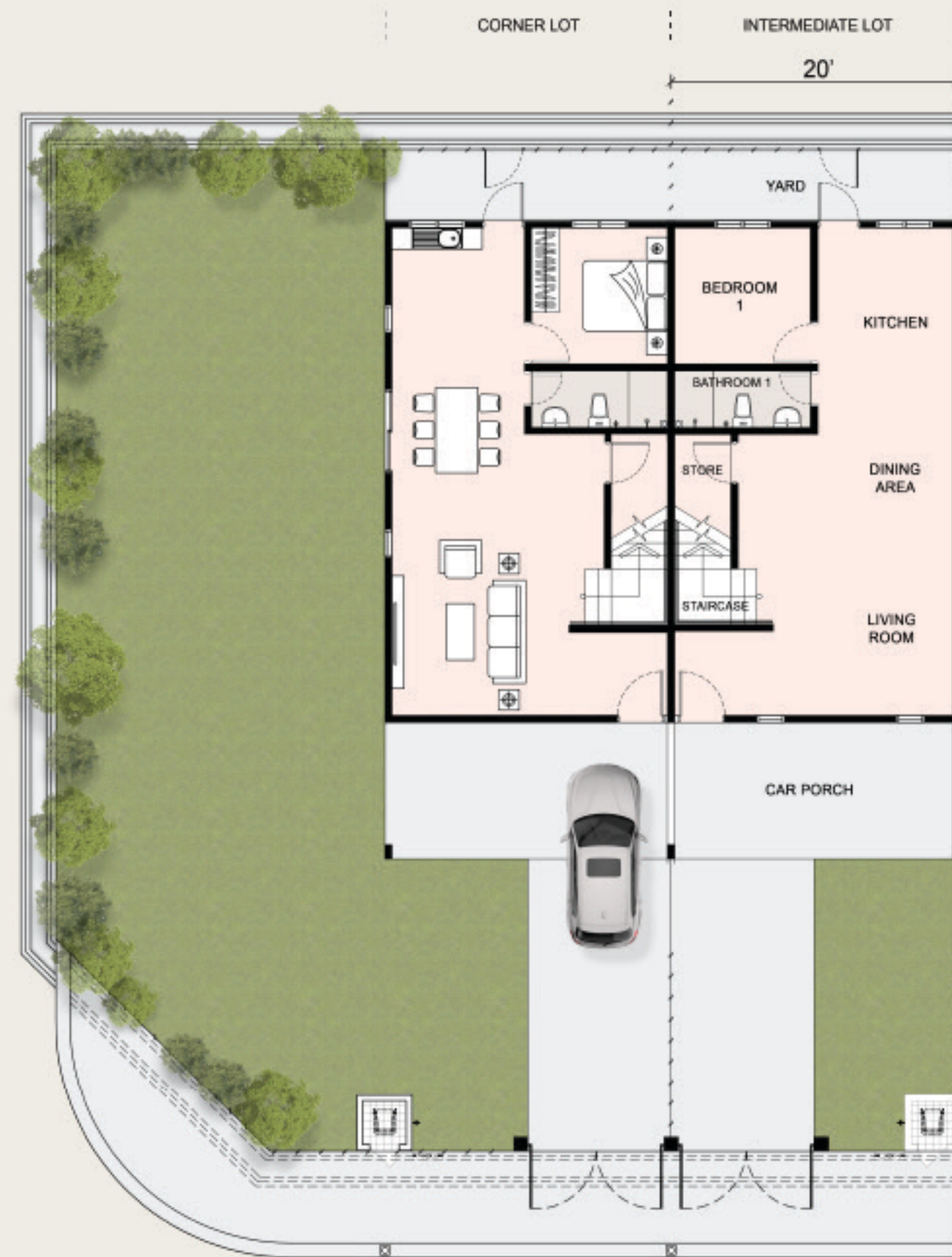
Ground Floor Plan